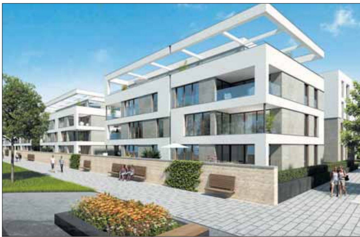
Bevorzugter Blick ins Grüne: So sollen die „WohnGut“-Stadtvillen an der Promenade aussehen.