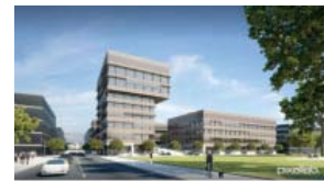
Sky Lab, Fischer Architekten